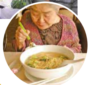
誕生日にホテルランチ、 豪華！