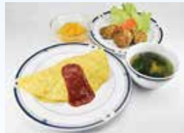
クリスマスのメニュー

11月1日より、給食業者がナリコマエントープライズに変更となりました。変更の際には、入居者様により美味しく食事を召し上がっていただけるよう、何度も盛り付けの勉強会や試食会を行いました。行事食も増え、季節を感じていただきながら今まで以上に食事が楽しみの一つとなるよう、食事を提供していきたいです。感染性胃腸炎が流行する季節となっていますので、手指洗浄など感染症対策を強化していきたいと思っております。