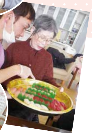
お寿司で忘年会、やっぱり マグロかしら？