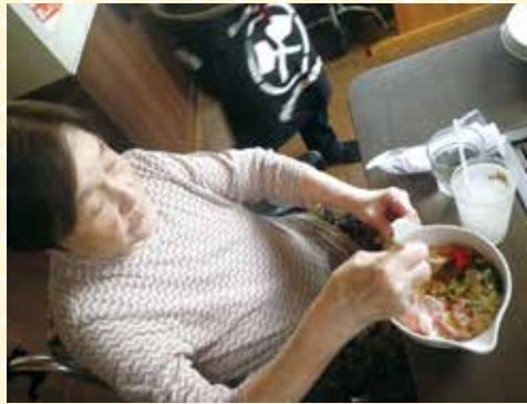
お好み焼きに挑戦、うまく焼けるかな？