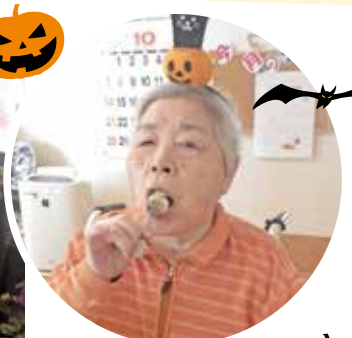
自分たちで デコレーション