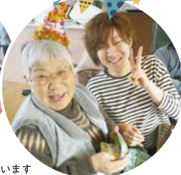
おめでとうございます