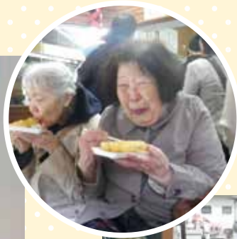
定義山名物油揚げ、美味しい～