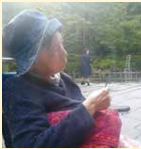
松島に外出。紅葉はもう少しかな？