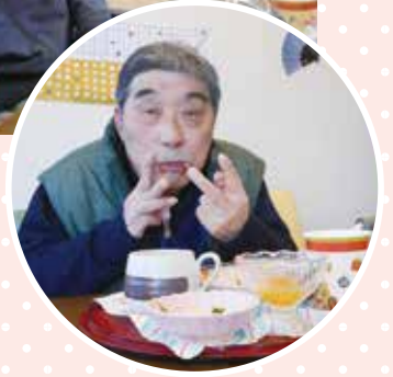
口にいっぱい 頬張って ピースサイン