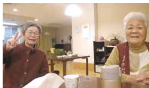
年末恒例歌番組をみて盛り上がりました。