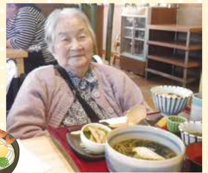
喜久水庵でおそばランチ