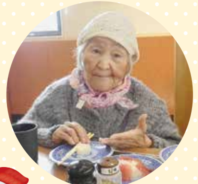
大好きなお寿司 何から食べよう??