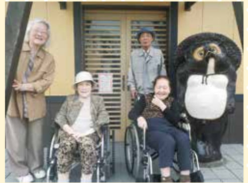
お腹いっぱいになりました！