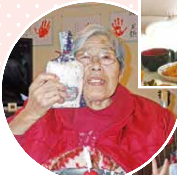
プレゼントもらって パシヤリ