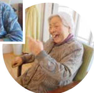
溢れんばかりの笑顔