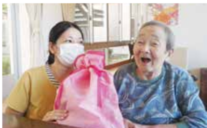
お誕生日おめでとうございます