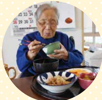
炊きたてのご飯にご満悦