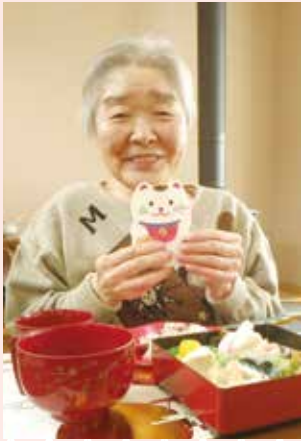
お年始もらって嬉しい☆