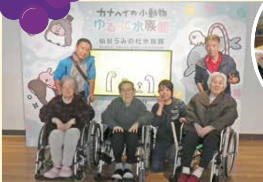
みんなで水族館にお出かけしました