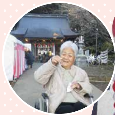
いい一年になるようお祈りしました