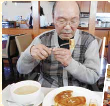
コーヒーとデザートで至福の一時