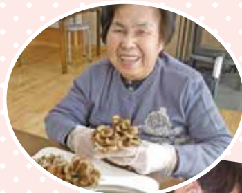
忘年会のお手伝い お疲れ様です