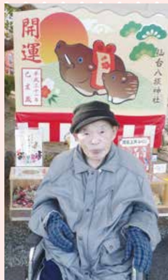
開運祈願してきました