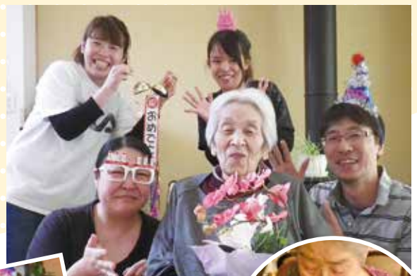
お誕生日、みんなで お祝いしました