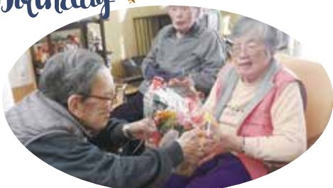
大好きなお花のプレゼント