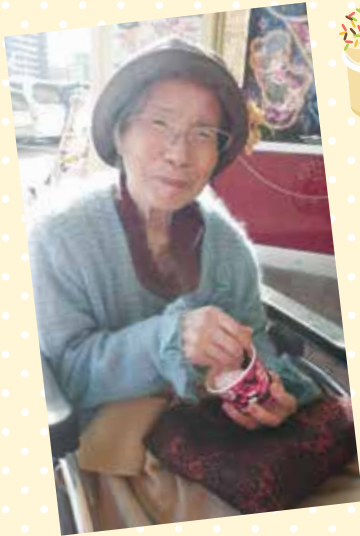
アイスクリーム、 冷たいけど美味しい～