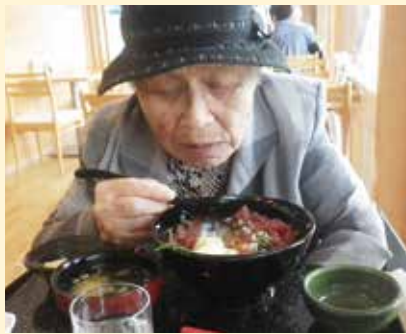
外で食べるご飯はすすみますね