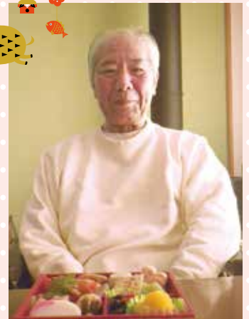
立派なお節料理と一緒に