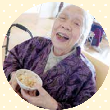
とっても美味しいよー!!