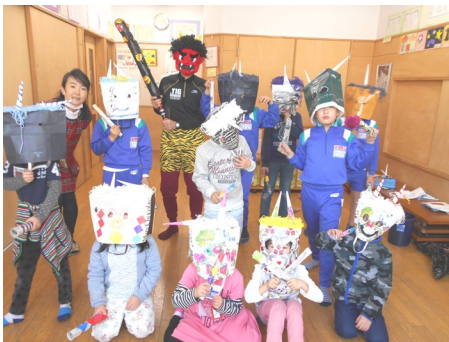
昨年のお面づくりの様子