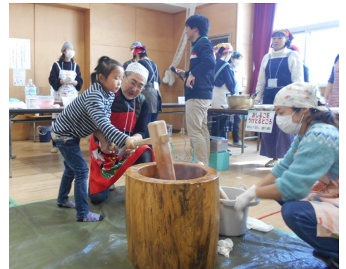
去年のもちつきの様子 たくさんのボランティアさんにお手伝いいただきました。