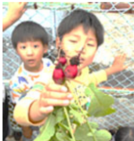
6月7日赤かぶ収穫 す。