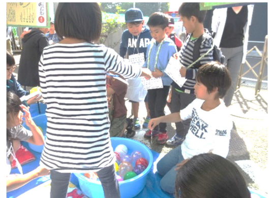
去年の様子:水ヨーヨー