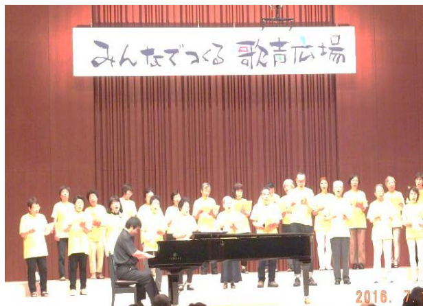
乳銀杏うたう会 ステージ発表の様子

乳銀杏歌う会 13年前乳銀杏の樹の下に生まれた、地域のうたう会です。乳銀杏保育園のホールで毎月一回日曜日の午前中、50人ほどで大好きなうたをうたっています。