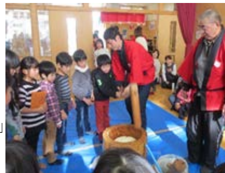
1月16日(土) 餅つき大会

リクエストしてくれた4年生さん。あなたのおかげで、大事な話し合いができました。ありがとう!宮城野児童館ではこういうリクエスト、大歓迎です。