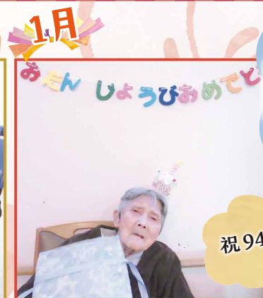
サンタさんからプレゼント 頂きました(^▽^)/