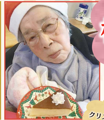
ふわふわ、しゅわ! 甘くておいしいね!