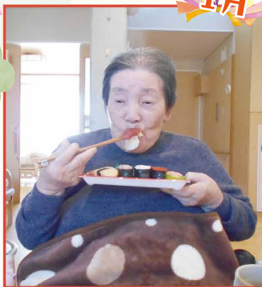
久しぶりにお寿司を出前で頼み、 美味しくいただきました!