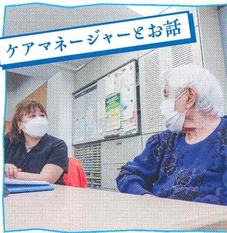
ケアマネージャーとお話