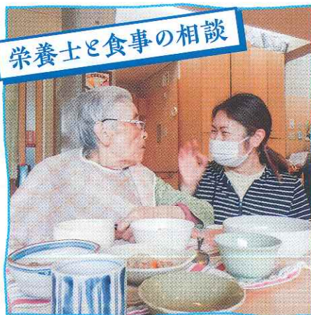
栄養士と食事の相談