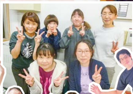
利用者様、ご家族の皆様から「また利用したい」と思われるショートステイを目指します。