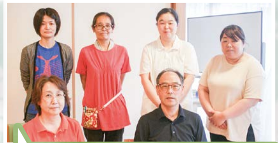
私たちスタッフ一同は、利用者様の自立支援に向けて充実したケアを実現できるように頑張っております。