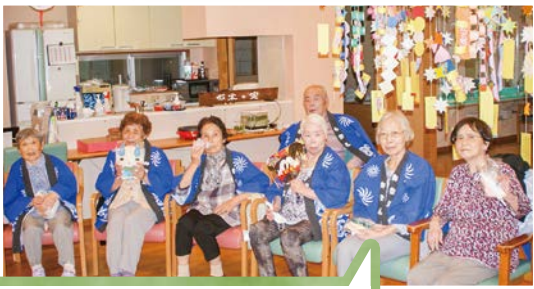
ミニ夏祭りを開催。法被姿になって颯爽としている利用者の皆様たち。金魚すくいや的当てなどを興じられ、昔を懐かしんでおられました。