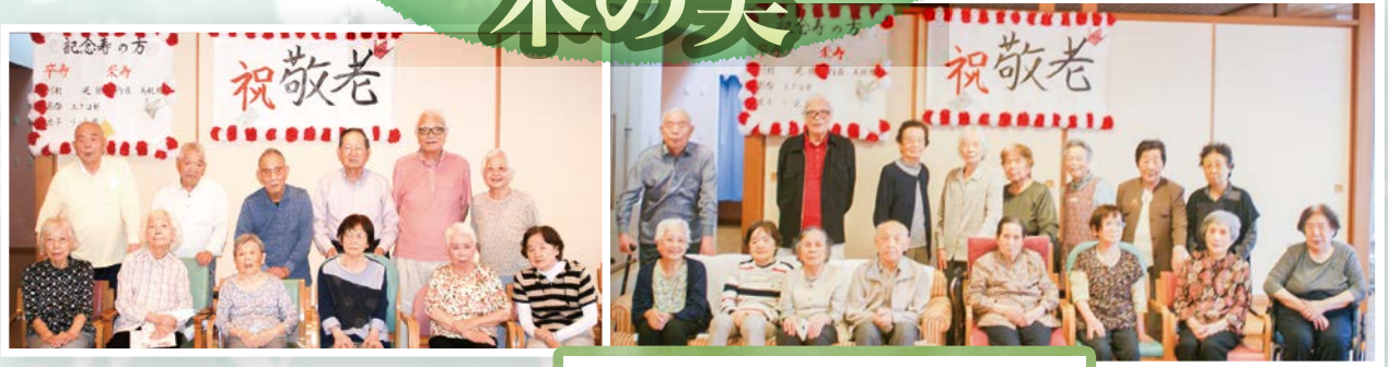
令和3年度の敬老会。米寿、卒寿を迎えた方がおられ、お祝いしました。