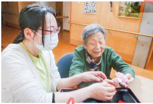
職員と一緒に手作りカーネーション作り。どんな感じのものが出来るかわくわくです。