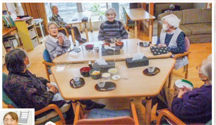
おやつ時間のひととき。笑い声が聞かれ、楽しい時間です。