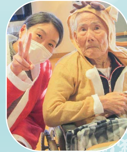
サンタとトナカイ