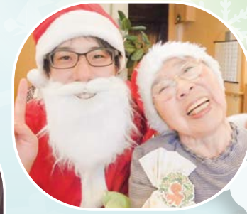
笑顔で ツーショット