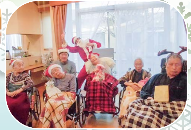
クリスマスパーティ!!