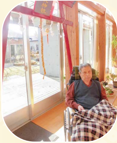
元朝参りしてきました