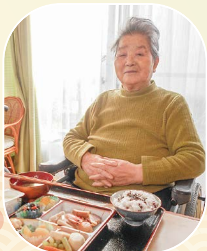
今年もよろしくお祈いします