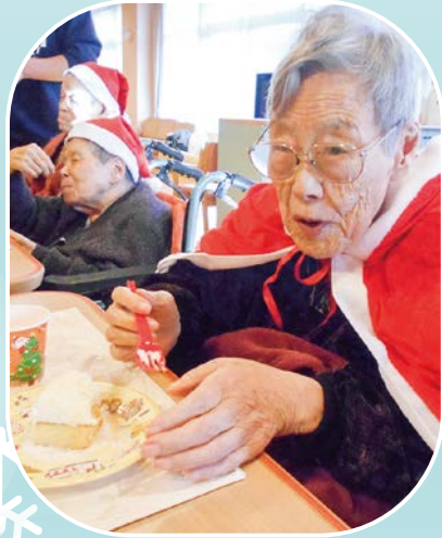
ケーキ美味しいです♡