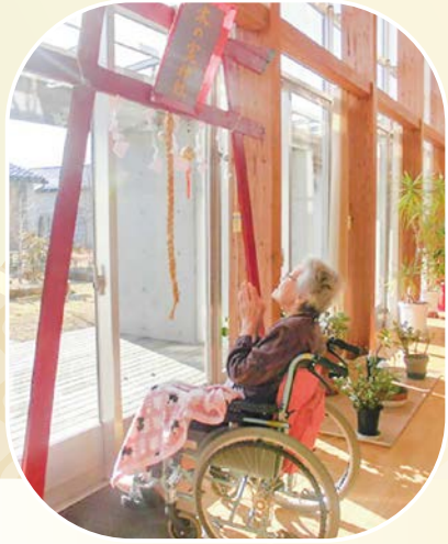
今年も いい年になりますように