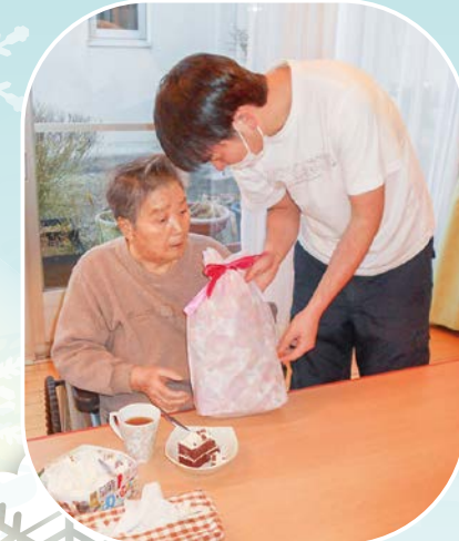
プレゼントの中身は 何でしょうね?