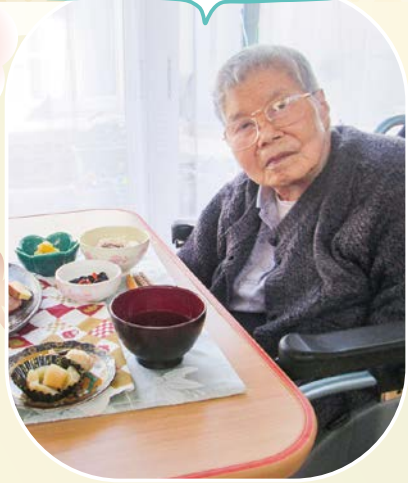
明けまして おめでとうございます