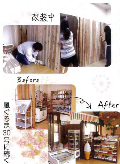
風の音の万周屋へ

びっくりするくらい器用な職員達ですが、施設長からの「失敗したら元に戻せよ！」というプレッシャーを受けての改装でした。みなさんの憩いの場になればという、熱い思いで改装された売店です。